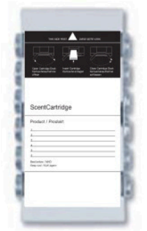
1 ScentCartridge ScentCartridge

Zubehör und Verbrauchsmaterial: SCENTCOMMUNICATION ScentCartridge