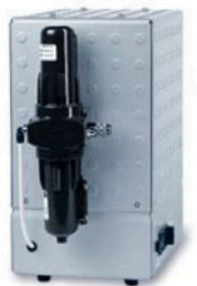
3 Air Management pump unit Air Management Pumpeneinheit