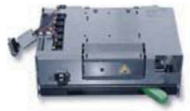
2 ScentDeck ScentDeck